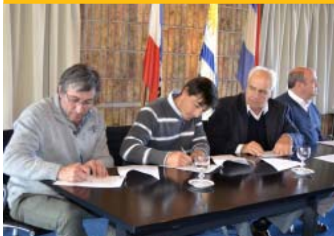
"Touring BBC" de Paysandú