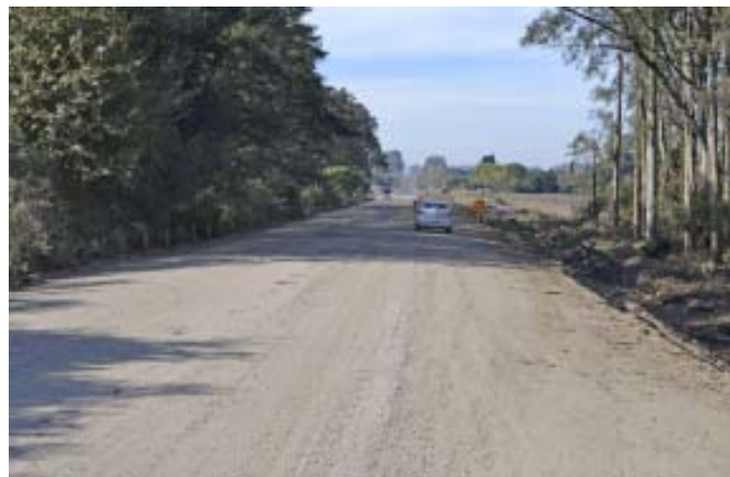
Ruta 22 - Paso Antolin