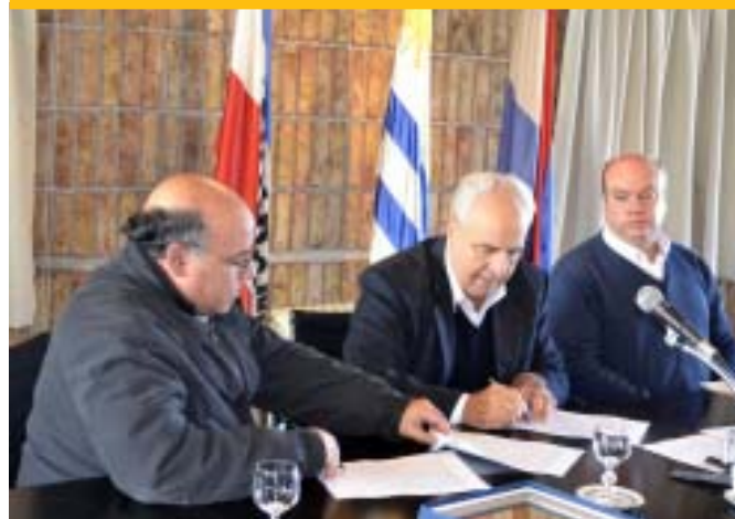
"Asociación Jubilados, Pensionistas y de Abuelos"