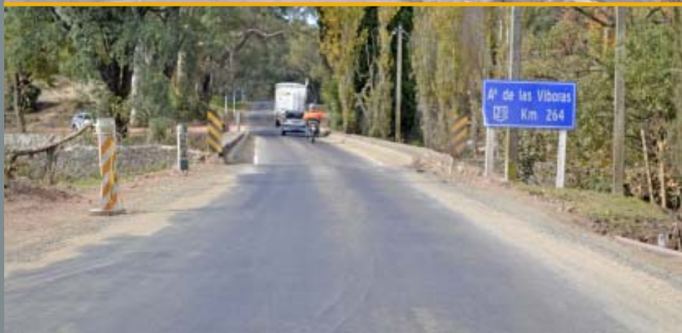
Ruta 21 - Km. 264 - Arroyo Las Víboras (foto superior 21 de abril, foto inferior 27 de abril)