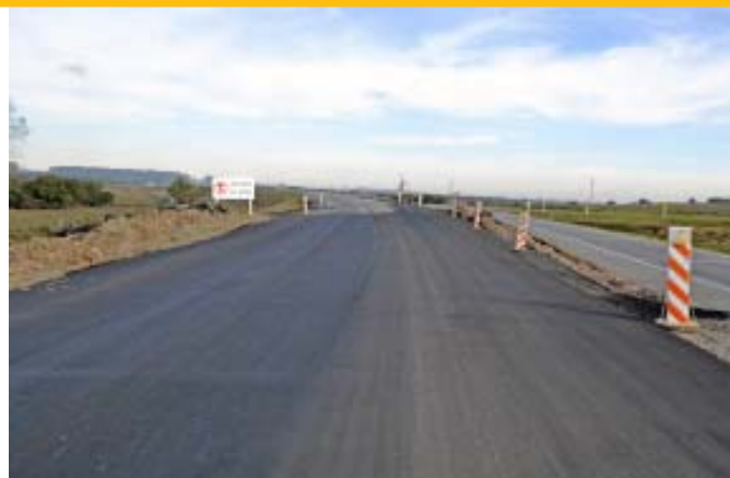
Ruta 1 - Km. 127

En esta ruta se encuentra trabajando la Regional VII de la Dirección Nacional de Vialidad en coordinación con la empresa Ramón C. Álvarez, contratada para ejecutar el recapado con concreto asfáltico del tramo de ruta 22 entre ruta 21 y Tarariras. La celeridad en los trabajos de reconstrucción permitió liberar el tramo al tránsito el día 10 de mayo. Actualmente se encuentra en pavimento granular y ya se trabaja en ejecutar las capas de concreto asfáltico en ese punto.