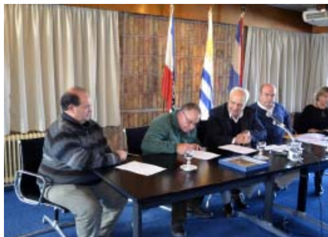
"Catedral de San José de Mayo"

El tercer convenio suscrito fue con el "Ferrocarril Fútbol Club" del departamento de Salto, a quienes el convenio permitirá construir servicios higiénicos para uso de la piscina y el gimnasio, así como gradas