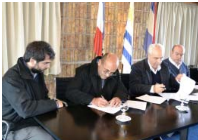
"Club Atlético Florida"

El ministro señaló además el carácter diverso de los proyectos, que atienden no solo aspectos sociales sino también culturales y patrimoniales del país. "Aparecen proyectos de convenios para jóvenes con capacidades diferentes, con abuelos que necesitan un hogar, con instituciones deportivas y también la parroquia de San José, con problemas edilicios