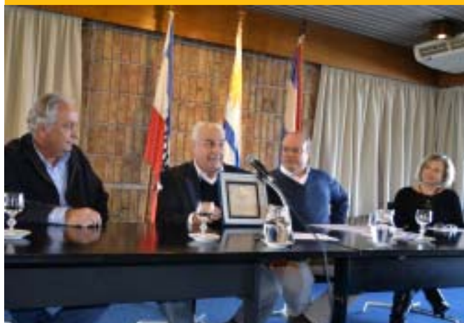
"Ferrocarril Fútbol Club" de Salto