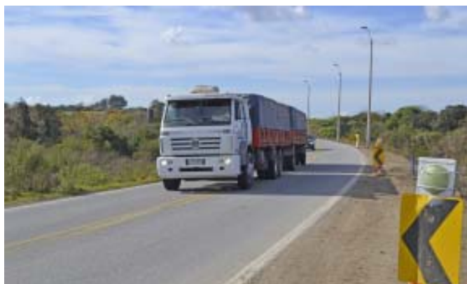
Ruta 21 - Puente El Pelado