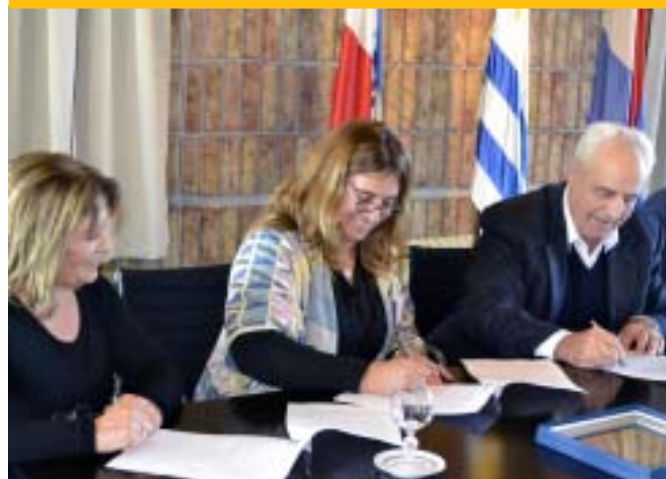
"Agremiación Ruralista Cabildo Abierto"